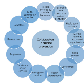
Picture: Colaboradores en la Prevención del Suicidio. Personas afectadas por la conducta suicida, Aquellos que se han involucrado en una conducta suicida, Proveedores de servicios de salud, Organizaciones y asociaciones de salud mental, Servicios Sociales, Gobierno, Departamento de salud, Servicios de emergencia, Servicios de abuso de sustancias, Empleados, Investigadores, Educadores, Miembros de la comunidad.

La investigación sugiere que los esfuerzos de prevención del suicidio serán mucho más efectivos si abarcan múltiples niveles e incorporan múltiples intervenciones. Ésta requiere la participación de intervenciones que ocurren en las comunidades e implican cambios sociales y políticos, así como intervenciones que se dirigen directamente a las personas. Para alcanzar nuestro objetivo común en la prevención de la conducta suicida nosotros como público, nosotros como organizaciones, nosotros como legisladores y nosotros como miembros de la sociedad debemos trabajar en colaboración, y de forma coordinada, utilizando un enfoque multidisciplinario.